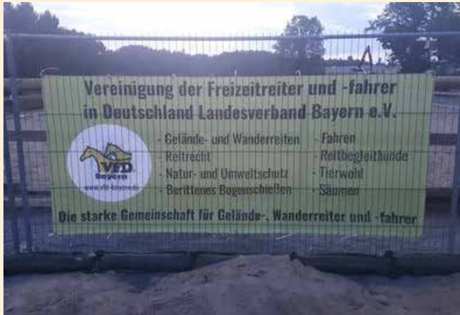
Eva Lauterbach, Hochfranken