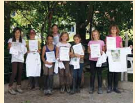
Die glücklichen Prüflinge nach bestandener Prüfung