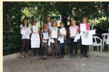
Die Prüflinge nach bestandener Prüfung.

Und natürlich durfte auch geritten werden. Die Juniors 1 und 2 zeigten ihr Können auf dem Reitplatz, die Prüflinge zum Junior 3 mussten zusätzlich wissen, wie man sich in einer Reitergruppe im Gelände und im Straßenverkehr verhält. Die angehenden Geländereiter übten darüber hinaus auch das richtige Verhalten in Notfallsituationen. Und das war auch aus Ausbilersicht nicht ganz einfach zu trainieren. Denn die Gegend rund um Oberstdorf ist ein Paradies für Touristen – und folglich ist es kaum möglich, einen Ort zu finden, wo einen Unfall simuliert werden kann, ohne dass ein Spaziergänger glaubt, es sei tatsächlich etwas passiert. Und so wurde stets ein Reiter beauftragt, während der Übung jedem Spaziergänger und Radler zu