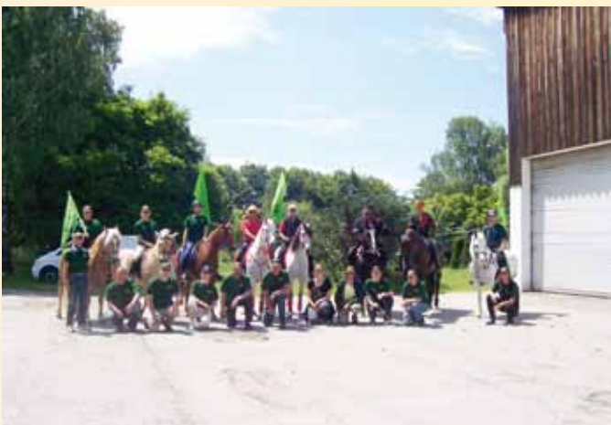
Pferd International - Das Showteam