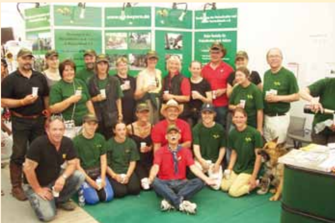
Pferd International - Das Standteam