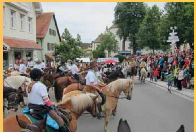
Freundschaftsritt - Ankunft in Peiting